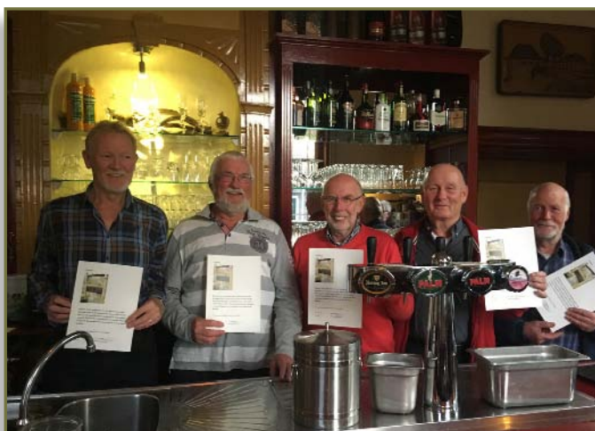
De technische club: meesters in de orde van de valschut